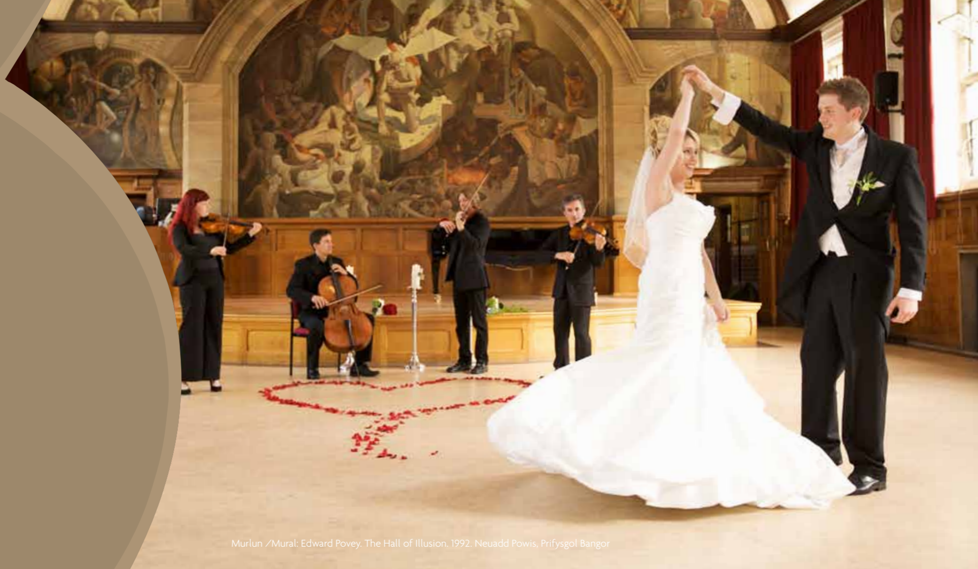
Murlun /Mural: Edward Povey. The Hall of Illusion, 1992. Neuadd Powis, Prifysgol Bangor

Capacity - up to 90 formally seated or 200 maximum capacity