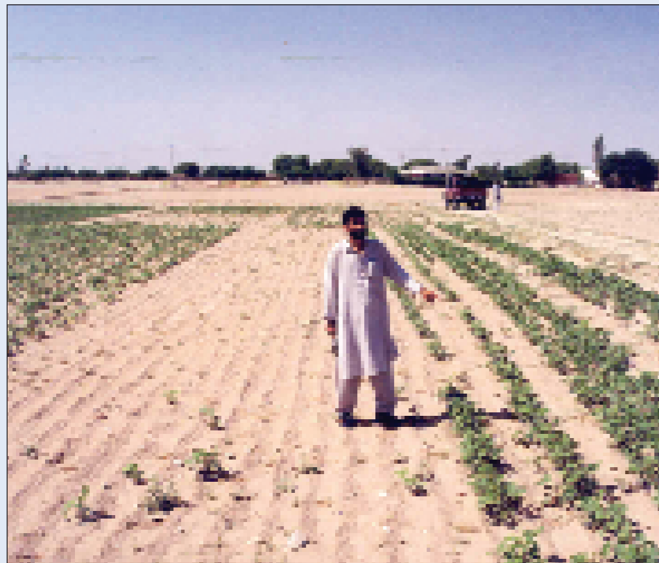
Gall preimio hadau fod yn ddefnyddiol mewn nifer o leoliadau ac ar gyfer llawer o wahanol gnydau. Yma, ym Mheshawar, Pacistan, mae preimio hadau'n golygu'r gwahaniaeth rhwng cael cnwd llwyddiannus o ffa mwng ar y dde a dim cnwd o gwbl!

Fel y dywedodd Dave, "Dwi'n meddwl bod hon yn enghraifft wych o'r ffordd mae'r system i fod i weithio: ymchwil-canlyniadau-ymholiad ar wefan-cyngor-problem wedi ei datrys."