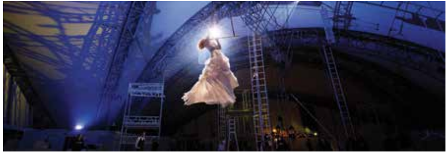
No Fit State Circus