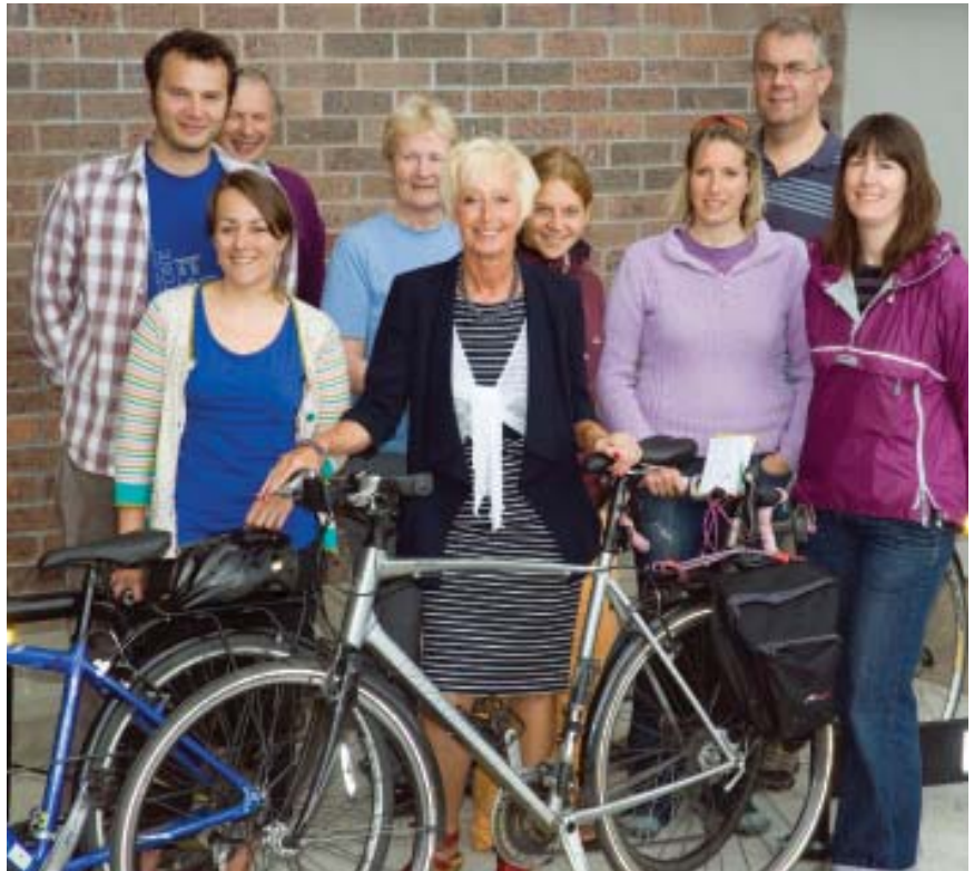
Rhai aelodau o dîm seiclo'r Ysgol Gwyddorau Eigion a enillodd y categori maint 20-49.

Roedd yr Her yn gyfle i gydweithwyr fynd ar eu beics a chael hwyl yn cystadlu yn erbyn gweithleoedd eraill yng Ngwynedd a Môn ■