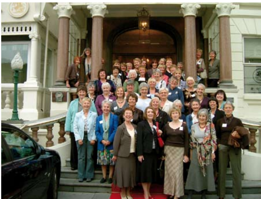
Aduniad cyn-fyfyrywyr Y Santes Fair yn Llandudno

'DIBEN Y RHAGLEN CYSYLLTIADAU ALUMNI YW GALLUOGI ALUMNI I GADW MEWN CYSYLLTIAD Â'I GILYDD A CHYDA'U HEN BRIFYSGOL...'