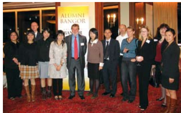
Yr Is-Ganghellor yn cyfarfod ag alumni yn China, Tachwedd 2007

Nod y Brifysgol yw sicrhau bod ei rhaglen cysylltiadau alumni nid yn unig yn cefnogi cenhadaeth y sefydliad ond ei bod hefyd yn darparu ar gyfer anghenion ei chyn-fyfyrywyr.