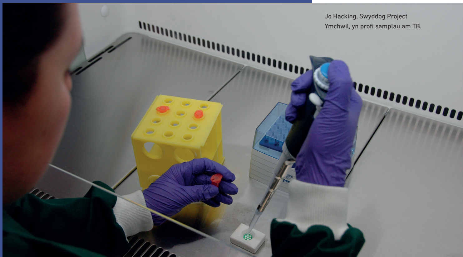
Jo Hacking, Swyddog Project Ymchwil, yn profi samplau am TB.

Mae rhai o greaduriaid mwyaf mawreddog y blaned, fel eliffant Affrica, mewn perygl difrifol o ddiflannu o ganlyniad uniongyrchol i weithgareddau pobl.