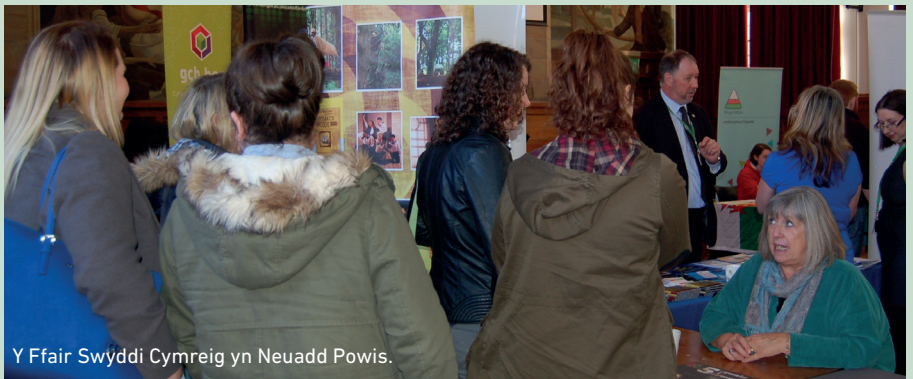
Y Ffair Swyddi Cymreig yn Neuadd Powis.

yr ystod o gyfleoedd sydd ar gael iddynt fel siaradwyr Cymraeg ac fel myfyrwyr sydd wedi astudio drwy'r Gymraeg."