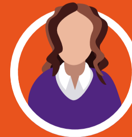
Eirian Griffiths Swyddog Cyflogadwyedd