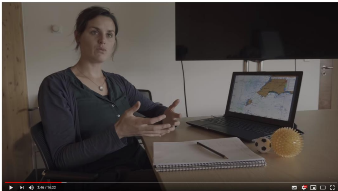
SWIM TO ENLLI Unlisted